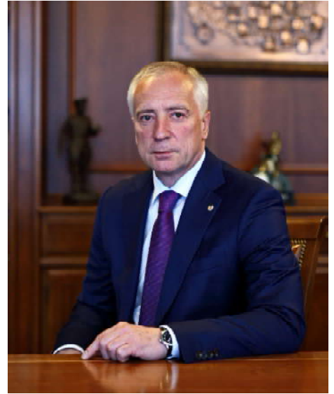
Губернатор Томской области Владимир МАЗУР

С юбилеем, родная Томская область! С праздником, лучший ее миллион!