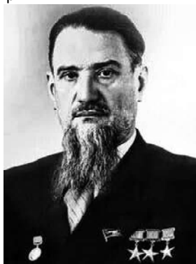
Игорь Васильевич Курчатov 12.01.1903 - 07.02.1960

В настоящее время НИЦ "Курчатowski институт" является одним из крупнейших научных центров России, как по численности, так и по широте научных интересов и экспериментальных возможностей не только в атомной науке и технике, но и в различных областях физики. В НИЦ "Курчатowski институт" входят специализированные институты и научно-технические комплексы.