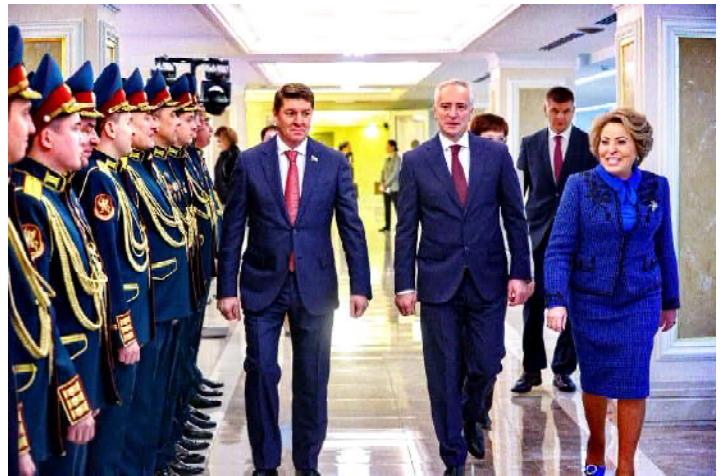
Департамент информационной политики Администрации Томской области

По итогам проведения Дней региона администрация Томской области разработает план мероприятий по взаимодействию с федеральными органами исполнительной власти для реализации всех рекомендаций, содержащихся в Постановлении Совета Федерации.