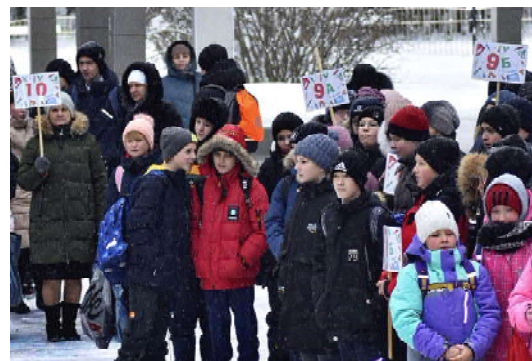
Отдел образования Администрации города Кедрового