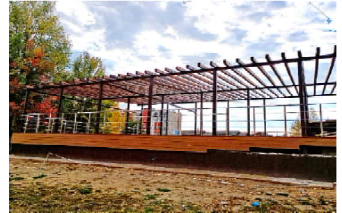
Администрация города Кедрового

В ближайшие дни работы по благоустройству общественной территории "г. Кедровый, общественная территория в 1 мкр. "Центр 1.0." (зона №3) (1 этап) будут завершены.