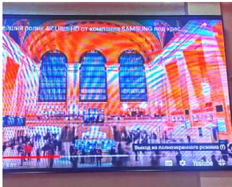
Модульный светодиодный экран в ГДК

Использование данной техники позволит осуществлять демонстрацию различного видео и фотоконтента, создавать эффект трехмерного изображения, применять оригинальные визуальные эффекты и многое другое.