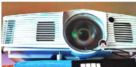
Проекционное оборудование в СДК

Первый - приобретение проекционного оборудования в Дом культуры с. Пудино, второй - оснащение Дома культуры г. Кедрового модульным светодиодным экраном. Общая стоимость приобретенного оборудования составила более 1,6 млн. руб., причем большая часть денежных средств поступила из федерального бюджета.