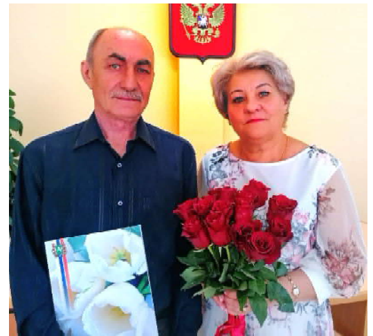
Отдел ЗАГС города Кедрового

И дай вам Бог и дальше вместе жить, заботу и любовь в сердцах хранить!